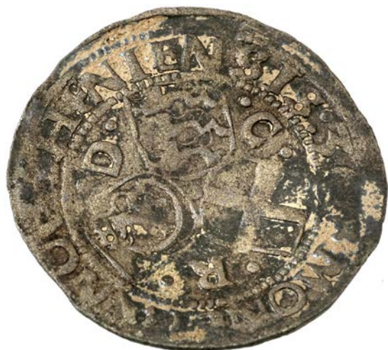
Sølv mønt fra 1536 fundet ved udgravningen i 2007.