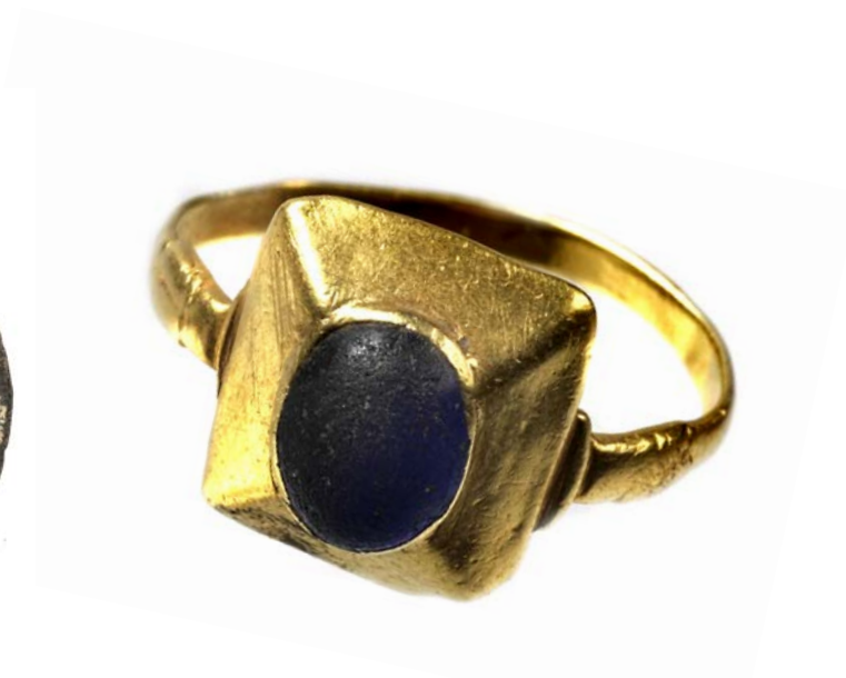
Guldring med indfattet blåt glas eller safir. Dateres ud fra paralleller til 1200-tallet og er dermed et af de ældste fund fra Nebel.