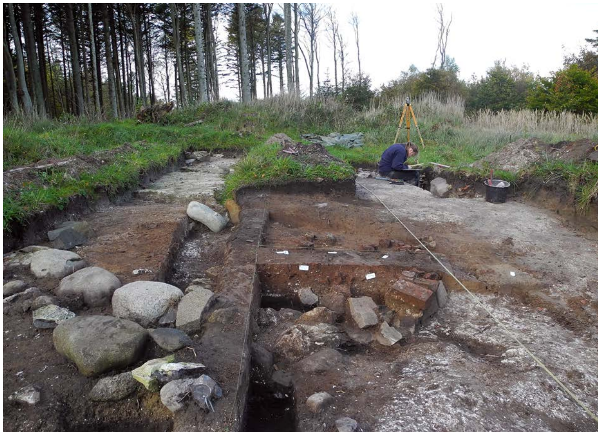
Foto fra udgravningen i 2014. I forgrunden ses syldstensrække i et af husene og midt i billedet resterne af en stor bageovn.

Vi formoder således, at Nebel blev placeret her i 1200- eller 1300-tallet, og bygningerne blev flyttet herfra i 1632. Det kan derfor være omkring 300 års historie, der er akkumuleret i de arkæologiske spor på det ældste Nebel, og det er vigtigt at holde sig for øje, at ikke alle bygningslevn og genstande har været i brug på én gang og af de samme mennesker. Et forhold, der i øvrigt også er gældende på mange detektorpladser med fund fra flere århundreder.