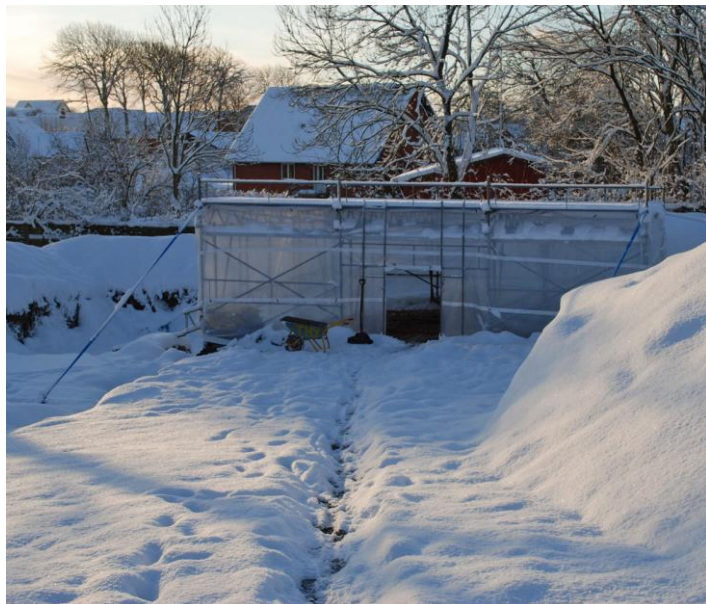
Udgravningen i vinterdragt, overdækket med telt.