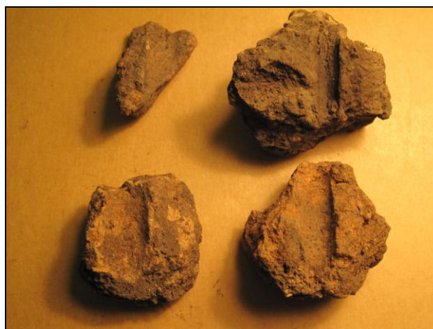
Lerklumper med aftryk af grene fra lerkuplen over ovnen.

Når man betragter det kan man ikke helt gøre sig fri af den tanke, at den omhu der er lagt i drejektiværnens placering også havde betydning ud over det rent praktiske, f.eks. at sikre et godt resultat når ovnen blev brugt. Anvendelse af kasserede kværnsten i en ovnbund kendes også fra Sjørring.