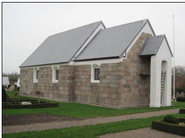
Tilsted kirke. Kirken er formentlig samtidig med tørvehusene ved skolen.

Kirken blev bygget i løbet af 1100-tallet og er altså formentlig samtidig med de udgravede tørvehuse ved skolen.