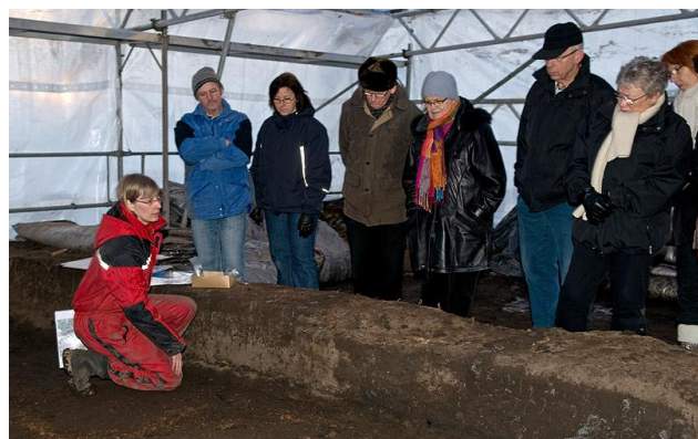
Interesserede besøgende ved åben udgravning.