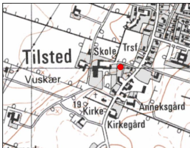
Tilsted på 4 cm kortet. Udgravningen er angivet med en rød prik.

Vi kommer tæt på datidens mennesker. Fra husene har man kunnet følge det leben, der var på bakken mod syd, hvor kirken rejste sig af firkantede granitkvadre, og nogle af landsbyens beboere har sikkert taget del i byggearbejdet på forskellig vis.