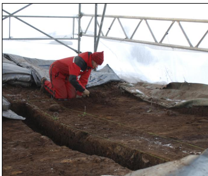
Hus 2 udgraves

Hus 2 lå cirka 30 m sydvest for hus 1. Det ligner stort set hus 1 med en, nu delvis ødelagt ovn op mod nordvæggen. Husets vestende lå uden for byggefeltet, mens østenden formentlig er fjernet i forbindelse med afgravning af muldlaget ved byggeriets start. Dele af både den nordlige og den sydlige langvæg kunne erkendes som rektangulære aftegninger af tørv. Huset kunne afdækkes i en længde af 7 m.