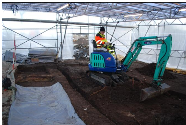
Minigraveren i arbejde i teltet ved hus 2. Til venstre for maskinen ses resterne af husets ovn.

anvendt en rendegraver og til sidst en minigraver, der tilmed havde den fordel, at den kunne anvendes inde i teltet.