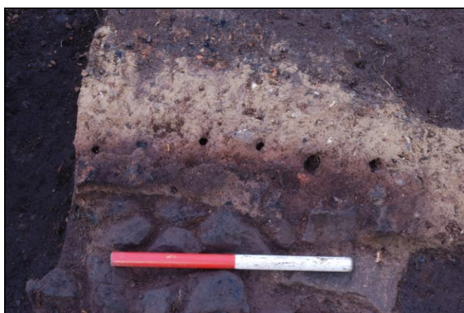
Tydelige aftryk af grene i ovnkappen.

Ovnen må betegnes som en af de bedst bevarede af sin art som museet endnu har udgravet. Ovne er det mest iøjnefaldende inventar i de middelalderlige tørvehuse. Den lå, som det stort set altid er tilfældet, op mod nordvæggen (der kendes meget få eksempler på en ovn op mod sydvæggen) og var opbygget med en lerdækket stenlagt bund. Den nederste del af ovnens overbygning var bevaret rundt om ovnbunden som en bræmme af tykt gult ler, der var rødbrændt ind mod selve ovnrummet og hvor der bl.a. kunne ses tydelige spor efter de grene som havde dannet skelettet for den leropbyggede ovnkappe.