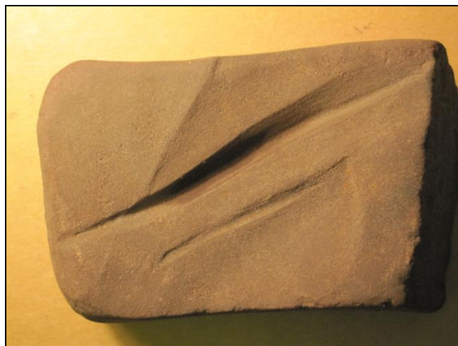
Slibesten fundet i kulturlag nord for hus 1.

Endelig fandtes en del dyretænder der vil kunne løfte lidt af sløret for hvilke husdyr man havde på gårdene i Tilsted.