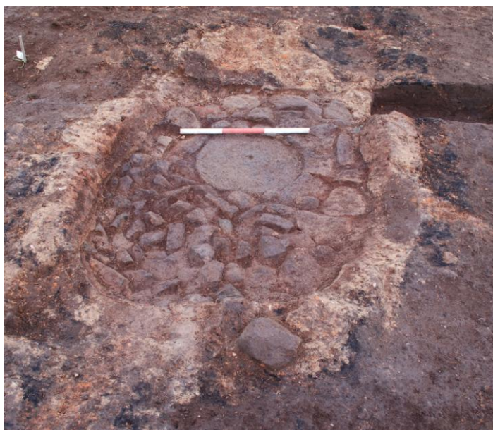
Ovnen i hus 1 set fra indfyringsåbningen. I stenbunden ses en genbrugt kværnsten.

I lerklumperne fandtes tydelige grenaftryk, og der var ingen tvivl om at der var tale om resterne af overbygningen til en ovn som da også snart kom til syne op mod husets nordvæg.