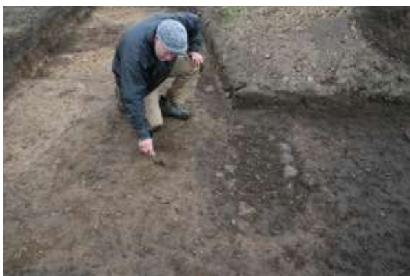
Den ene af de to grave afdækket ved forundersøgelsen, lige under pløjelaget

Højen ligger umiddelbart syd for et stort grusgravningsområde, og det kan forudses, at den inden længe vil blive berørt af grusindvindingen. I forbindelse med arkæologiske forundersøgelser på en anden del af arealet, hvor grusgravning var umiddelbart forestående, blev der lagt en søgegrøft over den overpløjede gravhøj. Derved blev der afdækket to grave lige under pløjelaget.