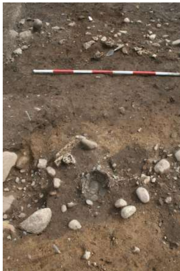
De tre grave ved udgravningens afslutning, set fra vest. I midten ses underdelen af urnen N6, tømt for indhold. Til venstre ses lidt af grav N2, og til højre lidt af grav N3. I baggrunden stensamlingen N4. Graveskeen peger på skårene af et lerkar, der muligvis er nedlagt som en offergave.

af mindre sten, N4, hvor der var nedsat eller henlagt mindst to lerkar. Det tolkes som et rituelt anlæg, der kan have forbindelse med dødekulten. Alle de fundne grave er anlagt i kanten af en ældre gravhøj. Den grav, der oprindeligt var anledning til, at højen blev bygget, blev ikke fundet ved denne undersøgelse.