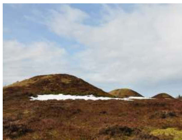
Fredede gravhøje på Ydby hede.

Det er også vigtigt at få afdækket stenlægninger og andre anlæg i kanten af højen. Den kan da sammenlignes med den store overpløjede gravhøj, der i 2008 blev undersøgt i grusgravningsområdet nordfor. Måske har vi at gøre med to familiegupper, der kan knyttes til hver deres huse.