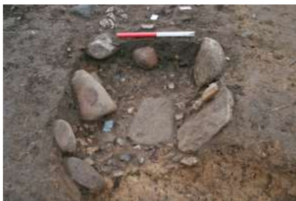
Den nordligste grav, N2, set fra nord. I snittet under målestokken ligger en nedfalden sten.

Som nævnt var de tre grave symmetrisk anbragt med urnegraven i midten og en stenkiste-lignende grav på hver side. Alle tre grave var brandgrave, og de er formentlig anlagt mere eller mindre samtidigt, eller med få års mellemrum.