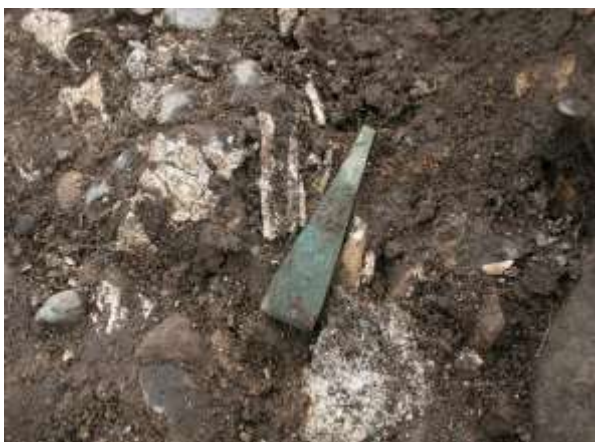
Pincet af bronze liggende mellem hvidbrændte knogler i grav N3.

Graven N3 længst mod syd var en lille, stenkisteligende grav ligesom N2 mod nord, men ligesom urnen var denne en mandsgrav med bronzegenstande: En fin pincet og en ragekniv blev fundet sammen med mange stumper brændt knogle iblandet ral og småsten.