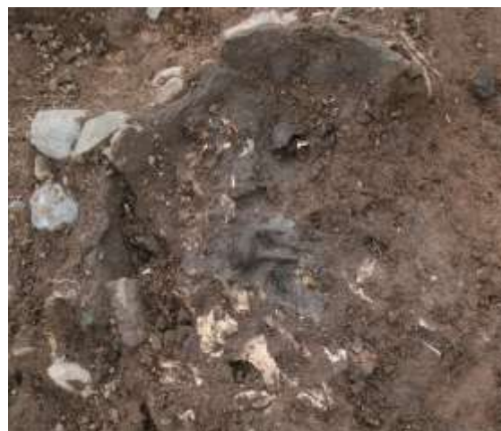
Urnegrav N6. En dobbeltknap af bronze med en 1,5 cm lang spids ligger i urnen mellem hvidbrændte knoglestumper.

Den nordligste grav, N2, målte ca. 45 x 80 cm indvendig. Bunden bestod af en større, flad sten omgivet af småsten, i kanten var der sat sten, der målte op til 20 cm. Graven bar spor af at være forstyrret, men lidt af den oprindelige fyld var tilbage med et indhold af brændte knogler.