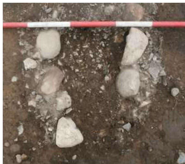
Grav N3 under udgravning. I højre side ligger bronzepincetten, se også næste side.

Mellem de brændte knogler i lerkarret fandtes 3 bronzegenstande: En meget fin dobbeltknap med lang spids, en ragekniv (se rapportens forside) og en lille syl. Ragekniven viser, at den døde har været en mand. Ploven havde fjernet den øverste del af lerkarret, men heldigvis var bunden med de gode fund intakt. Urnen stod på en flad sten, og der var tegn på, at den også har været omgivet af sten, som nu stort set var fjernede.