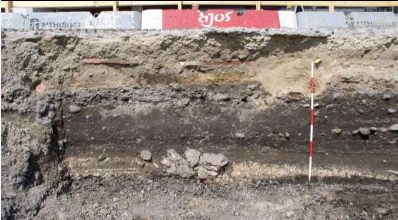
Figur 2. Foto af profil under Storegade med jordlag, der fortæller byens historie. Nederst over gruset ses lerlag med store sten, som er resterne af et hus. Derover mørke opfyldslag og vejlag, og øverst den moderne bys lag med ledningsgrøfter og brolægning.

Søgegrøfter på grunden viste kun nyere opfyld og bygningsrester, så der blev fokuseret på området ud mod gaden. Til alt held havde der ikke været kældre i hele bebyggelsen ud mod Storegade, og en ”knold” på ca. 6 x 5 m stod tilbage med uforstyrrede kulturlag og konstruktionsrester (knolden ses nederst i billedet på forsidenes foto). Her var der rester af to huse, som lå med gavlene tæt op mod hinanden, men som ikke har været i brug samtidig – hus 1 var ældre end hus 2 (se figur 3 og 4). Begge huse var delvis gravet væk af kældrene fra den senere bebyggelse på stedet, så vi kan ikke afgøre deres længde, men deres indvendige bredde var ca. 3 meter.