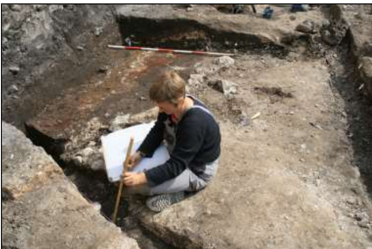
Figur 9. Der arbejdes med registrering af de fremgravede anlæg.

Museet kendte ikke omfanget af bevarede anlæg i området, men da entreprenøren havde fjernet bygningerne med tilhørende kældre syd for Storegade, stod det klart, at der i profilerne var kulturlag, der skulle undersøges. Museumsloven giver museet ret og pligt til at foretage en forundersøgelse, inden anlægsarbejdet kan fortsætte. Der blev truffet aftaler omkring budget og tidsplan med bygherren, som ifølge Museumsloven skulle betale undersøgelserne. Der blev foretaget en arkæologisk forundersøgelse og efterfølgende en egentlig arkæologisk udgravning af et lille område op mod Storegade, hvor der var bevarede kulturlag og anlæg fra middelalderen.