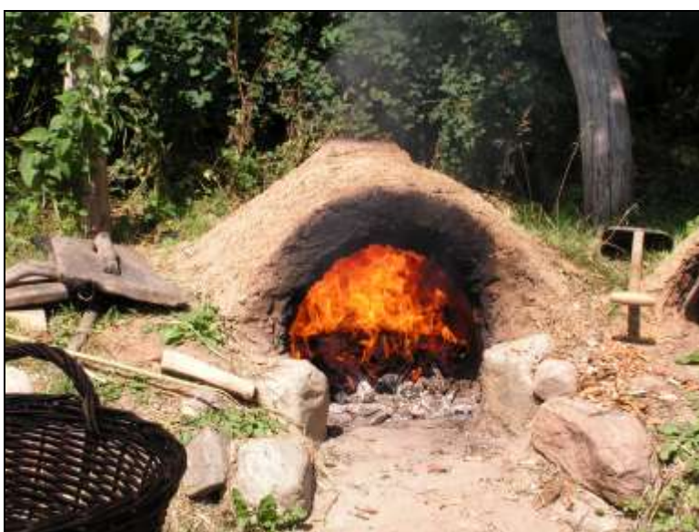
Figur 7. Kopi af bageovn af nogenlunde samme type, opført ved Heltborg Museum. Der er tændt op i ovnen. Til sidst skræbes gløderne ud og ovnen er klar til brug.