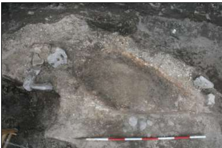
Figur 5. Ovnens under udgravning. En ovnbund af brændt ler er gravet frem. Til venstre i billedet ses stenene, der danner kant om indfyringsåbningen.