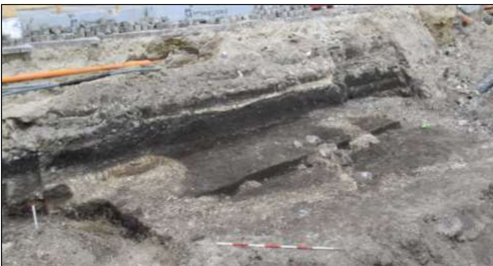
Figur 3. Hustomterne som de fremstod efter første afrensning. De lyse bæltter er lerlag. I midten den tværgående stenrække N1.

Søgegrøfter på grunden viste kun nyere opfyld og bygningsrester, så der blev fokuseret på området ud mod gaden. Til alt held havde der ikke været kældre i hele bebyggelsen ud mod Storegade, og en ”knold” på ca. 6 x 5 m stod tilbage med uforstyrrede kulturlag og konstruktionsrester (knolden ses nederst i billedet på forsidenes foto). Her var der rester af to huse, som lå med gavlene tæt op mod hinanden, men som ikke har været i brug samtidig – hus 1 var ældre end hus 2 (se figur 3 og 4). Begge huse var delvis gravet væk af kældrene fra den senere bebyggelse på stedet, så vi kan ikke afgøre deres længde, men deres indvendige bredde var ca. 3 meter.