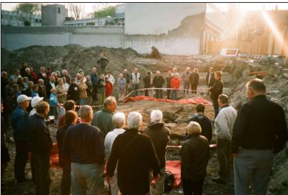
Figur 8. Som så ofte før oplevede vi under udgravningerne en stor interesse fra byens borgere. Mange synes, det er spændende at se, hvad der ligger skjult under vore fødder, og er interesserede i, hvad det kan fortælle om vores fælles historie. Den 26. april blev der afholdt et aftenarrangement med åben udgravning, hvor vi fortalte om udgravningens resultater. Bygherren serverede øl og vand til gæsterne ved arrangementet.

Thisted nævnes første gang i 1367, men der er ikke sikre grundlag for at opfatte stedet som en egentlig by på det tidspunkt. Kirkens ombygning kædes sammen med, at Thisted fik status som købstad midt i 1400-tallet, og det var nok da, der for alvor kom gang i etableringen af en by. Dette kunne vi også finde spor af i udgravningerne. Over hustomterne fra 1200-tallet lå tykke lag, der bl.a. indeholdt spor af en gadebelægning samt rester af et hus fra 1600- eller 1700-tallet, der lå med facade op mod Storegade. Øverst kom så de moderne lag – grus og sand i ledningsgrøfterne under nutidens gadeniveau.