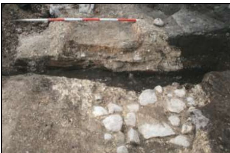
Figur 6. Snit gennem ovnen. Her ses, hvordan ovnen har haft to faser med tilhørende lerlag og stenbunde. Den ældste ovn var lidt smallere og lå lidt længere mod nord. Ovnens har ligget helt op mod ydervæggen mod nord.