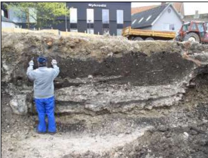
Figur 12. Snit gennem en kælder i området op mod I.P. Jacobsens Plads.

Op mod feltets østside, I.P. Jacobsens Plads stod en profil med et snit gennem en kælder. Dette snit blev tegnet og siden gravet bort med maskine. Inde bag profilen lå fjernvarmerør, så der var kun bevaret en lille del.