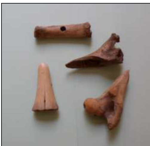
Figur 13. Fotos af udvalgte fund. Middelalderlige mønter, skøjte tildannet af en ko-knogle og forskellige benredskaber.