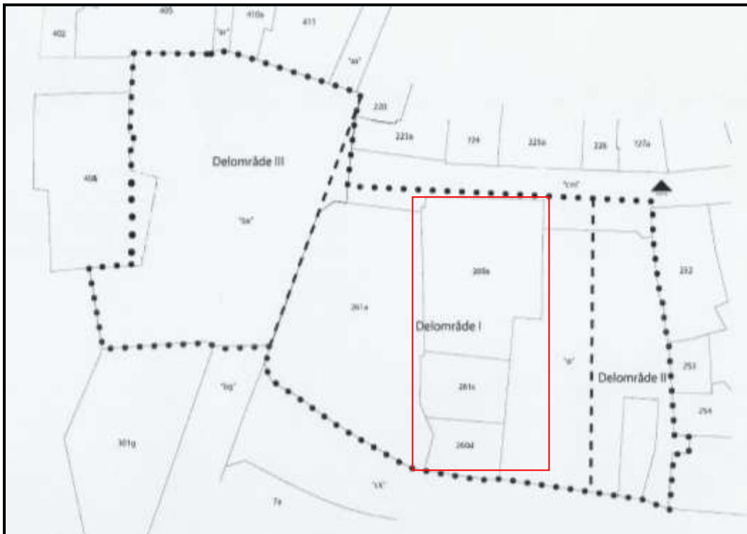
Figur 1. Kopi af lokalplanens kort over området, der skal bebygges. Forundersøgelserne fandt sted i den østlige del af Delområde I, på matriklerne 260a, 260c og 260d samt området "Ø" (markeret med rød firkant). Matrikel 261a (Skoringen) er ikke nedrevet endnu. Delområde III, Store Torv, er tidligere undersøgt ved arkæologiske udgravninger.

På det meste af byggepladsen var der ikke bevaret ældre strukturer, da der her havde været kældre og nyere bygninger. Op mod Storegade var der imidlertid noget at undersøge, bl.a. et areal på 30 m 2 , hvor der var bevaret rester af to huse, der kan dateres til 1200-tallet e.Kr.