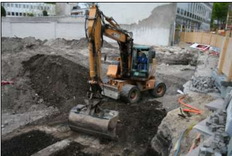
Figur 11. Med gravemaskine fjernes på udgravningens sidste dag de sidste spor af huset.