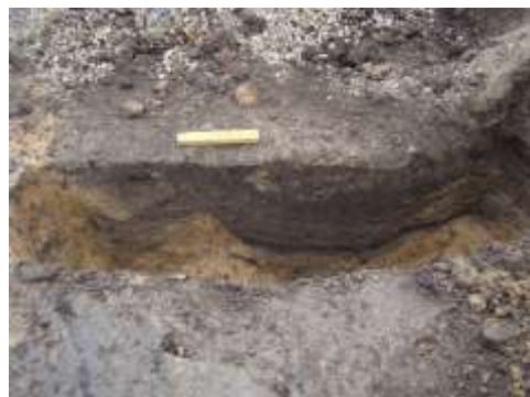
Figur 3. Et oversigtsfoto over feltet, hvor der skulle lægges fliser, viser to grøfter, der løber parallelt. Muligvis har man på et tidspunkt sløjfet en grøft og derefter gravet en ny i samme skelforløb. THY2198 dig092. Til højre et billede, der viser et snit, gravet gennem de to grøfter. Det sorte lag i bunden er slam, der er dannet her, inden grøften blev fyldt op. THY2198 dig 088.