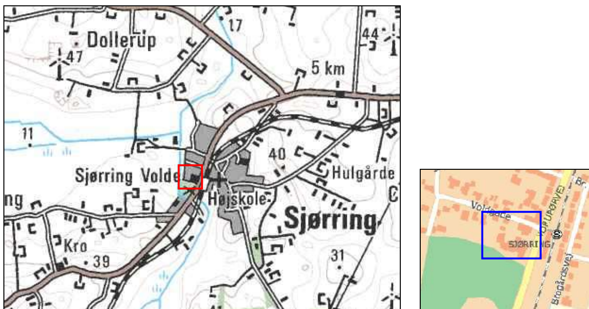
Figur 1. Kort over Sjørring. Udgravningen fandt sted i området, der er markeret med rød firkant. Tæt syd for udgravningsområdet ligger det markante middelalderlige voldsted Sjørring Volde, og øst for ligger den romanske kirke. Området tæt vest for byen var tidligere sø, men Sjørring Sø blev udtørret midt i 1800-tallet. Til højre et kortudsnit med Voldgade og efterskolens bygninger markeret indenfor den blå firkant

I henhold til museumsloven blev udgravningen finansieret af bygherren, Sjørringvold Efterskole. Undersøgelsen omfattede de 550 m 2 , der berøres af de aktuelle anlægsaktiviteter bag efterskolens nye værkstedsbygning.