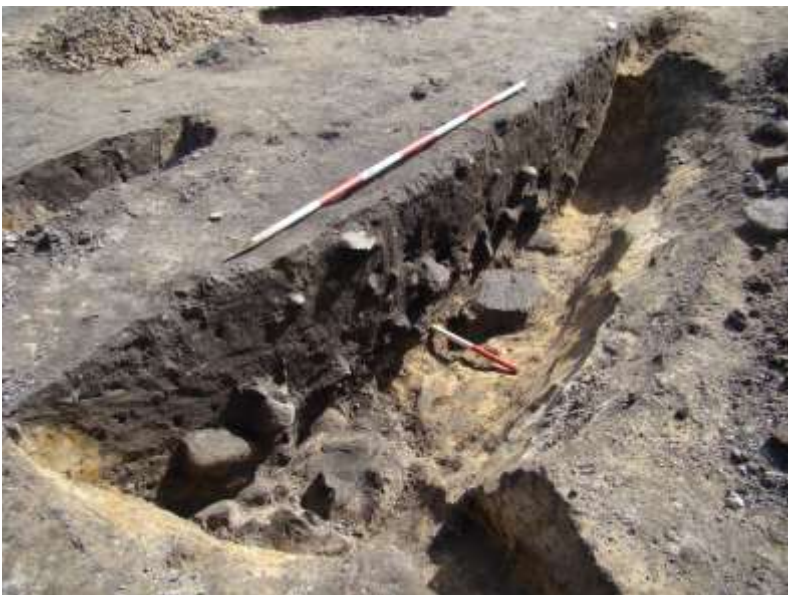
Figur 6. Når halvdelen af gruben var gravet væk, kunne man studere den lodrette profil og se eventuelle lagdelinger i fylden. Som billedet viser, var der et markant indhold af forholdsvis store, varmepåvirkede sten. THY2198 dig183.