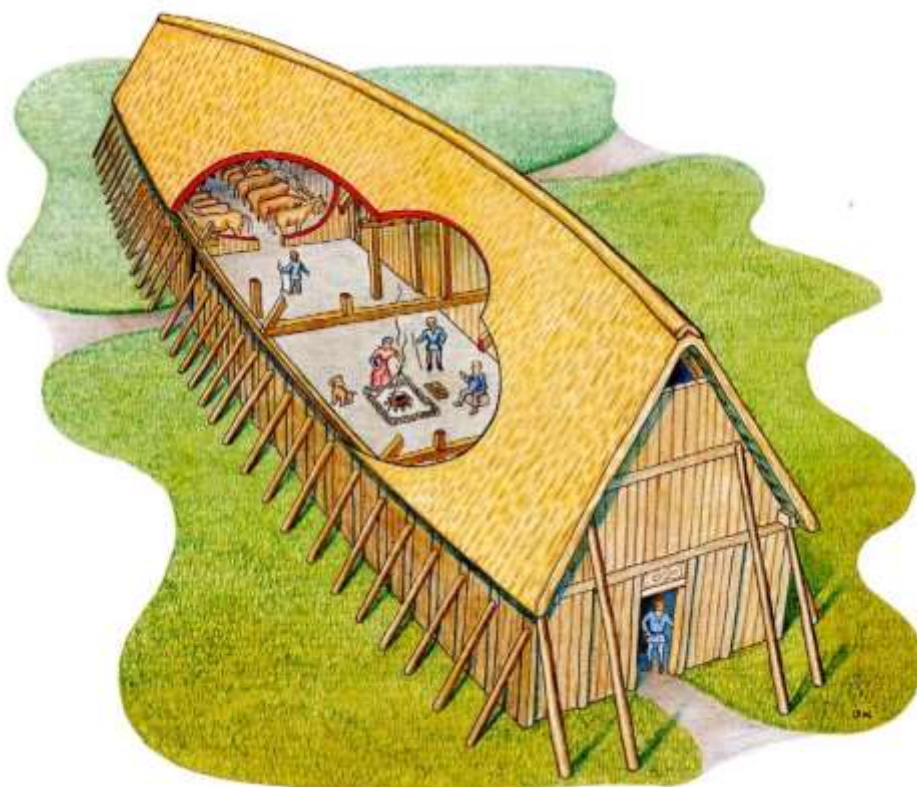
Figur 4. Rekonstruktion af langhus med buede langvægge – en hustype, der er karakteristisk for vikingetiden, og som bl.a. er udgravet på de store ringborge Trelleborg og Fyrkat. I det viste hus er der stald i den ene ende; det har ikke altid været tilfældet – næppe heller i det udgravede hus i Sjørring. Ildstedet på gulvet har været anvendt som varmekilde og til madlavning.

Ud fra beliggenhed og størrelse lykkedes det også at udpege stolpehuller, som kunne stamme fra væg og tagbærende konstruktion i et vikingetidshus. Et langhus, der har haft let buede langvægge, og som sandsynligvis har været beboelseshus på en gård. Huset har været min. 18 m langt og knap 7 meter bredt.