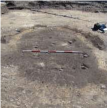
Figur 5. Gruberne fremstod som mørke, ovale aftegninger i undergrunden. THY2198 dig131.

I løbet af en gårds historie kan både beboelseshuse, andre bygninger og tilknyttede anlæg have flyttet lidt rundt på matriklen. I en arkæologisk udgravning vil der være spor af alle disse aktiviteter, og deres indbyrdes forhold viser, hvordan de skal opfattes i den relative datering af anlæggene.