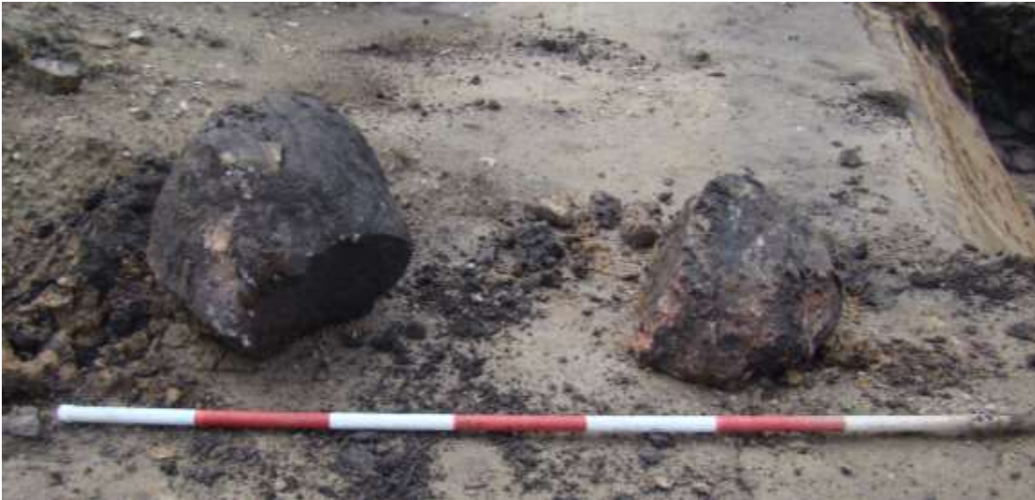
Figur 7. Et par af de store sten fra gruberne. De skarpe kanter og den smuldrende struktur er tydeligt tegn på, at stenene har været udsat for høj varme. THY2198 dig 230.