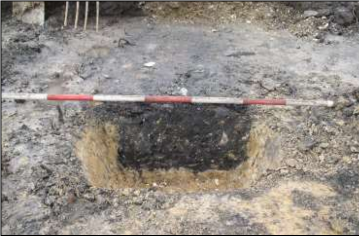
Figur 5. Foto af et snit gennem den aflange grube sydligst i feltet. Gruben var helt flad i bunden og med rette sider. Fylden var meget kompakt og med stort indhold af fragmenter af ildskørnede sten. Grubens funktion kendes ikke, men ud fra de ildskørnede sten at dømme, har der været brug af ild. De rette sider indikerer, at gruben ikke har stået åben gennem længere tid.