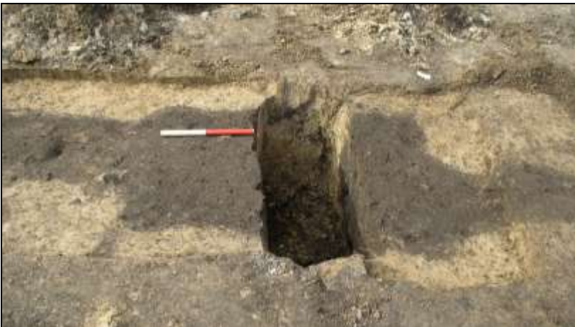
Figur 6. Ca. midt i feltet lå dyb grube med udløbere mod vest og øst. Anlæggets totale længde var godt og vel 8 meter. Gruben midt på var ca. 80 cm bred (N-S) og omkring ½ meter dyb. Et mørkt lag nederst i gruben havde indhold af forkullet organisk materiale, der var brændt i gruben.