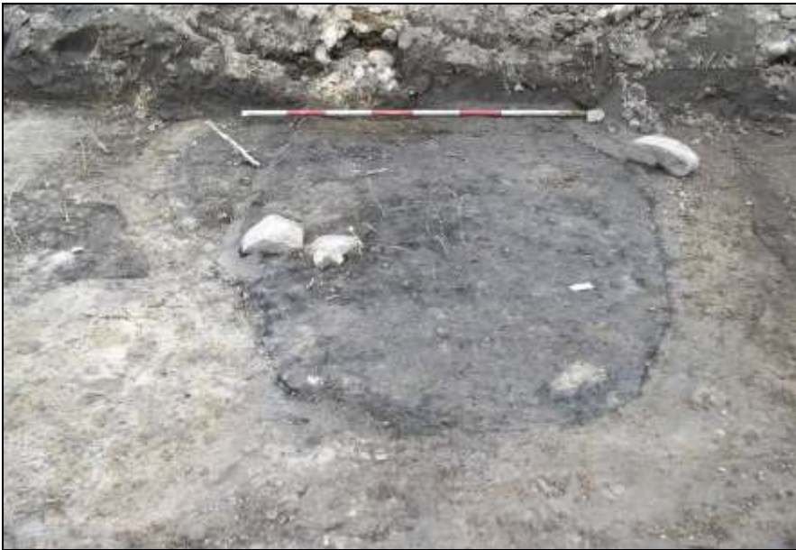
Figur 7. Smedjeområdet inden udgravning. Indholdet af trækul og spredte slaggestumper i det øverste lag antydede muligheden for, at der her var spor efter smedearbejde. Det viste sig, at det mørke lag på omkring 4 m 2 dækkede flere essegruber, hvor smeden har arbejdet med smedning. I et stolpehul i kanten af området har formentlig stået en stolpe, der har været del af en lettere bygning til smedjen.

Gruberne tolkes altså som små esser, hvorover man har foretaget rensning af jernet. Tilsvarende gruber er bl.a. fundet ved Viborg Søndersø og ved Starup Østertoft i Sønderjylland. På disse lokaliteter forekom essegruberne i en kontekst, der tolkes som hytter med fletværksvægge.