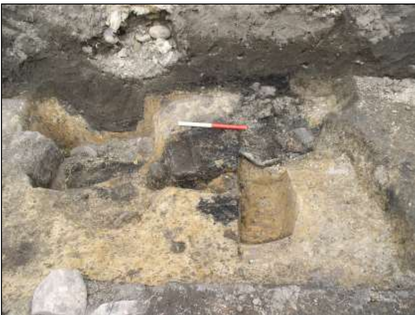
Figur 8. Smedjeområdet under udgravning. Fordybningerne er essegruber, der er helt eller delvis udgravet. De mørke lag indeholder slagger, trækul og brændt ler.