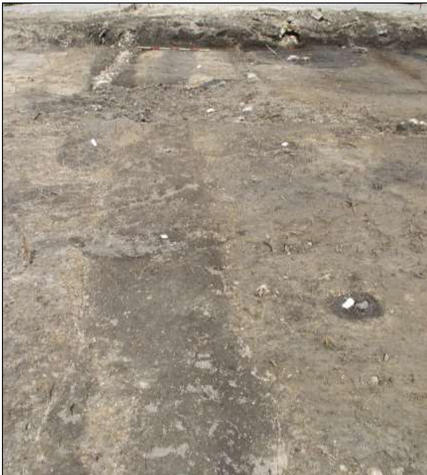
Figur 4. De mørke striber tværs over feltet er grøfter, der har for omkring 1000 år siden har stået åbne som en markering af skel omkring gårdene. Øverst i billedets højre hjørne ses det mørke område, hvor der udgravedes essegruber fra en smedje. Den runde aftegning nederst til højre er et stolpehul.

Grøfterne danner grænse mellem området mod øst, hvor der er stolpehuller, ”smedje” og gruber (se nedenfor) - og området vest for grøften, hvor der kun er en mindre vest-østgående grøft og en grube. Gruberne ligger til grund for, at området tolkes som et værkstedsområde på en vikingetidsgård, og de ret markante nord-syd gående grøfter kan måske repræsentere gårdens vestlige grænse.